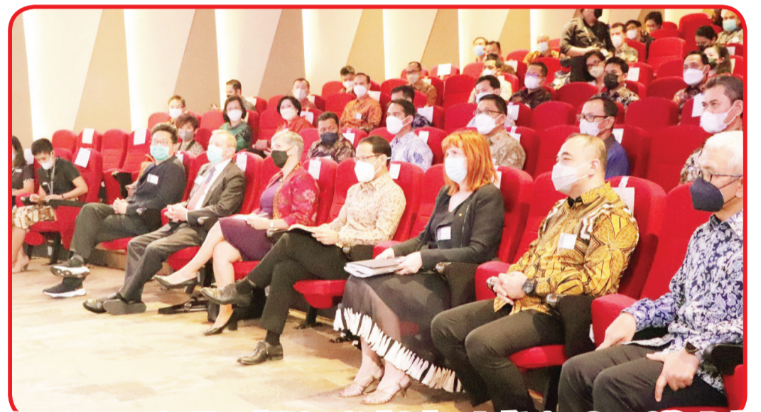
Suasana peresmian Monash University di Gedung Auditorium Green Office Park (GOP) 9, BSD City, Kamis (14/4).