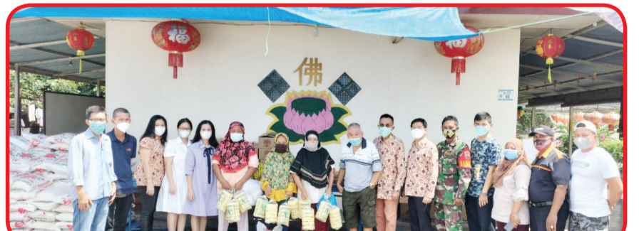
Pengurus Rotary Club Medan Deli berfoto bersama di Vihara Mogaalana.