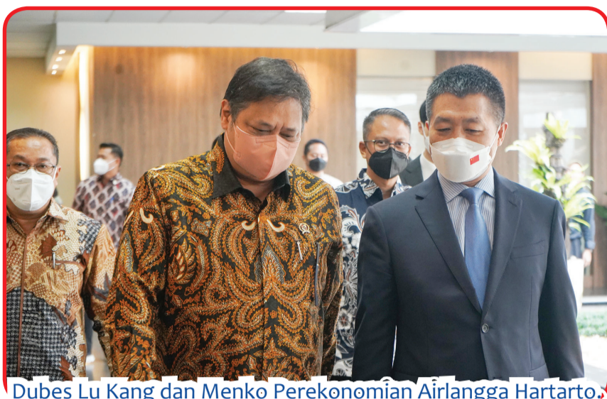
Dubes Lu Kang dan Menko Perekonomian Airlangga Hartarto.

JAKARTA (IM) - Dubes Tiongkok untuk Indonesia Lu Kang, Selasa (12/4) lalu melakukan audiensi ke Menteri Koordinator Bidang Perekonomian sekaligus Ketua Partai Golkar Airlangga Hartarto. Kedua belah pihak saling bertukar pikiran terkait pendalaman hubungan ekonomi perdagangan antara kedua negara. Juga interaksi dan kerjasama antara partai politik kedua negara dan penyelenggaraan KTT G20 2022 di Bali. ● idn/din