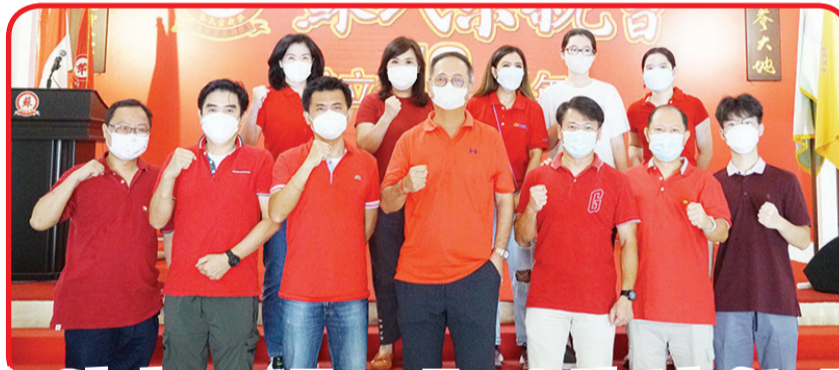
Seluruh anggota Yayasan Marga Su Jakarta berfoto bersama.