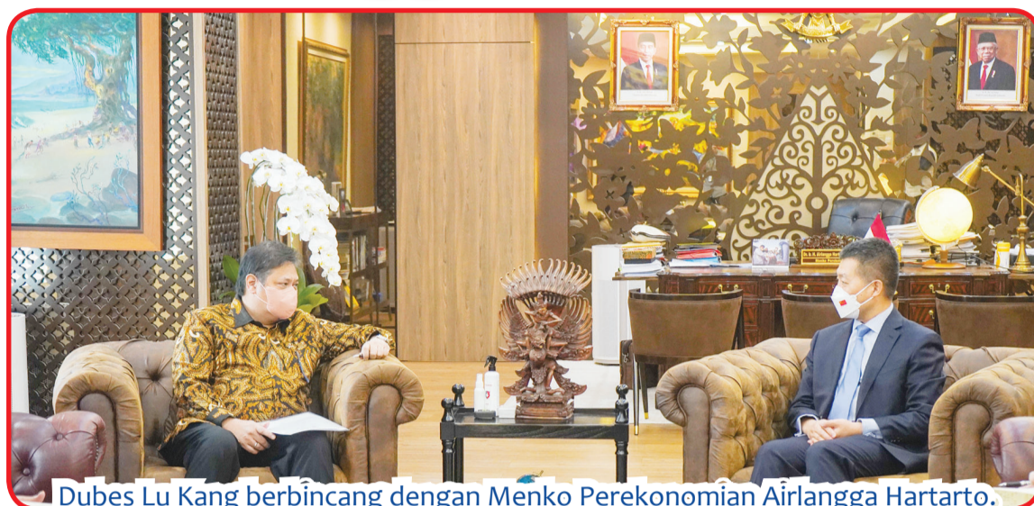
Dubes Lu Kang berbincang dengan Menko Perekonomian Airlangga Hartarto.