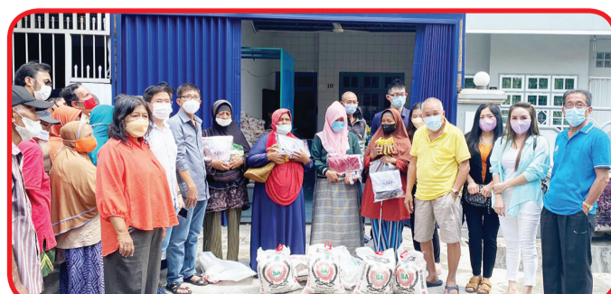
Pengurus Rotary Club Medan Deli berfoto bersama di kantor sekretariat Rotary Club Medan Deli.