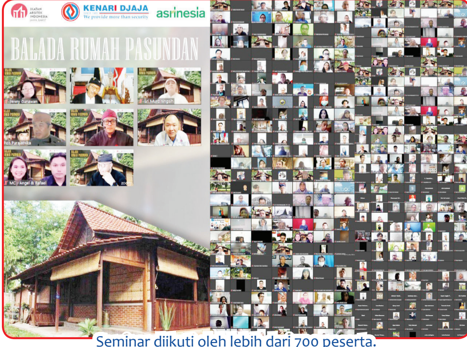
Seminar diikuti oleh lebih dari 700 peserta.

dicermati dan penelusuran pada arsitektur kekinian oleh Arsitek praktisi yang juga pengamat budaya Sunda Rd. Roza R. Mintaredja, IAI. Beberapa dari karya arsitekturnya ada juga yang memanfaatkan falsafah arsitektur Pasundan. Arsitek Pon S. Purajatnika, IAI yang ahli dalam membuat bangunan khas Jawa Barat, mengakrabi tata ruang rumah tradisional Jawa Barat yang diterapkan pada bangunan rumah bambu bergaya arsitektur modern. Seminar tentang Rumah Pasundan yang akrab dengan alam ini diikuti lebih dari 700 peserta dari kalangan Arsitek, Desainer Interior, mahasiswa, serta masyarakat pemerhati arsitektur. ● kris