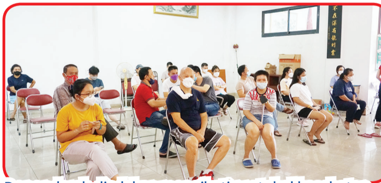
Donor darah diadakan mengikuti protokol kesehatan.