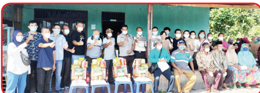
Pengurus Rotary Club Medan Deli berfoto bersama di kantor sekretariat Rotary Club Medan Deli.