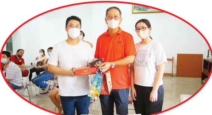
Pimpinan Yayasan Marga Su Jakarta secara simbolis menyerahkan hadiah.

JAKARTA (IM) — Pengurus Yayasan Marga Su Jakarta bekerjasama dengan PMI (Palang Merah Indonesia), Minggu (10/4) lalu menyelenggarakan donor darah di kantor sekretariat mereka di Taman Grisenda Blok E2/2 PIK Jakarta.