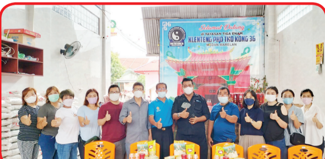
Pengurus Rotary Club Medan Deli berfoto bersama di Kelenteng Pho Tho Kong 36.

MEDAN (IM) - Selama Bulan Suci Ramadan dan menjelang Hari Raya Idul Fitri, Rotary Club Medan Deli membagikan paket sembako kepada warga kurang mampu. Seperti pada Sabtu (9/4) lalu diselenggarakan pembagian 300 sembako di Kelenteng Pho Tho Kong 36 Jl. AMD No 32 ABC Kawasan Medan Marelan.